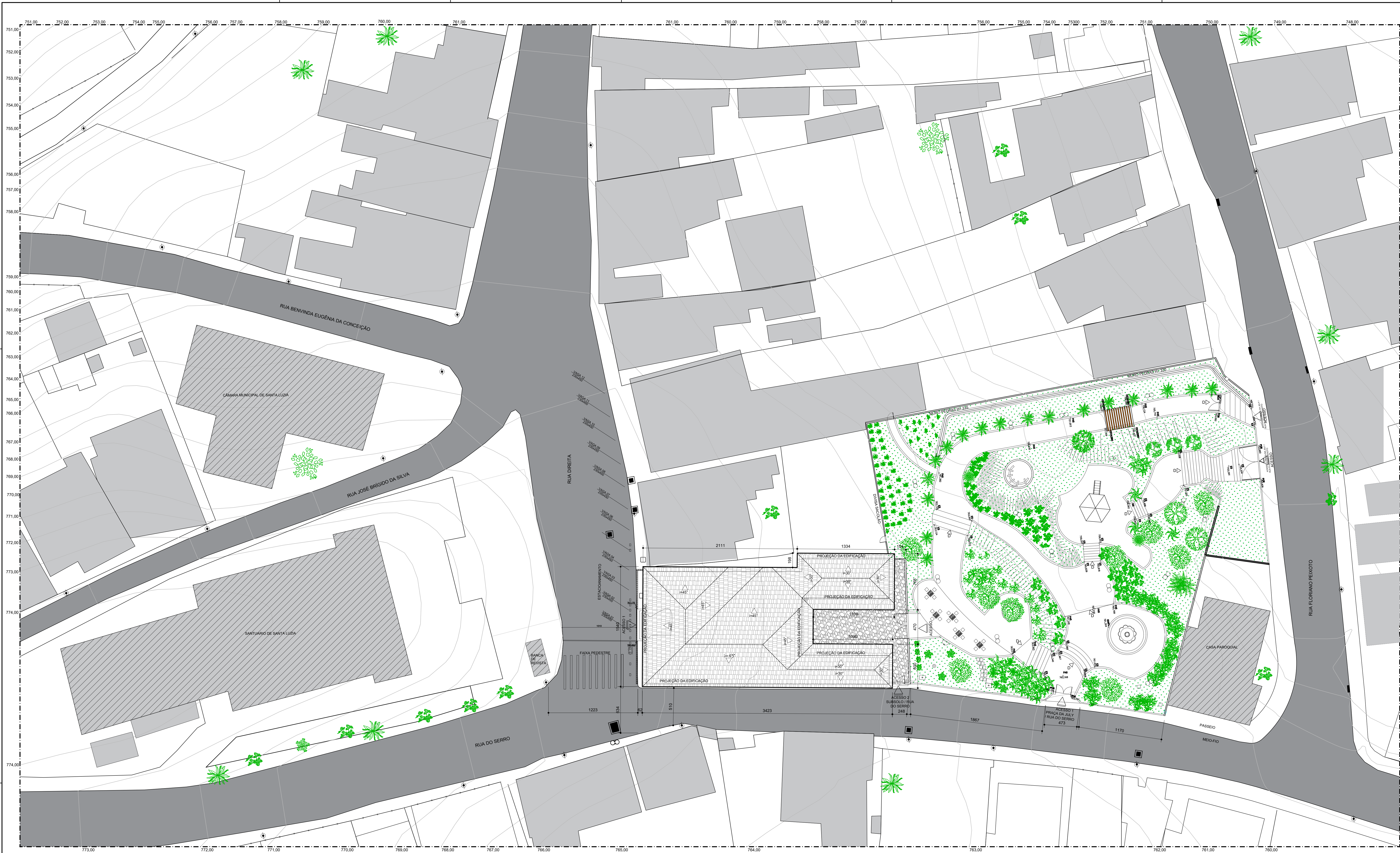
IMPLANTAÇÃO ESCALA 1:200